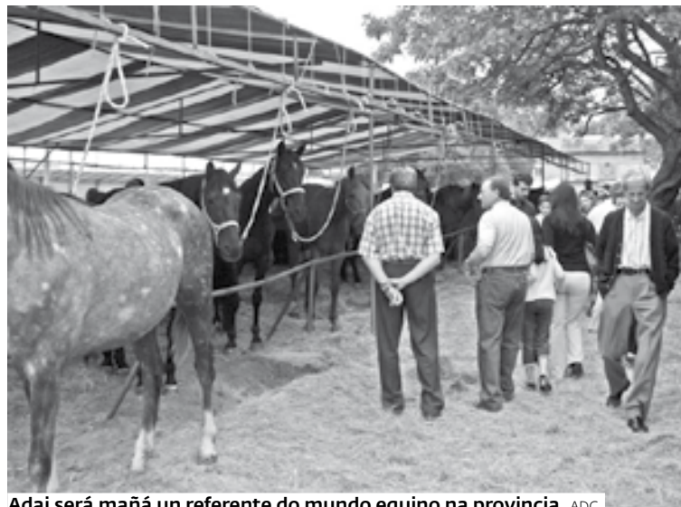
Adai será mañá un referente do mundo equino na provincia. ADC

TODA A XORNADA ESTARÁ AMENIZADA POLA CHARANGA: "OS CHARANGOS DE NEDA"