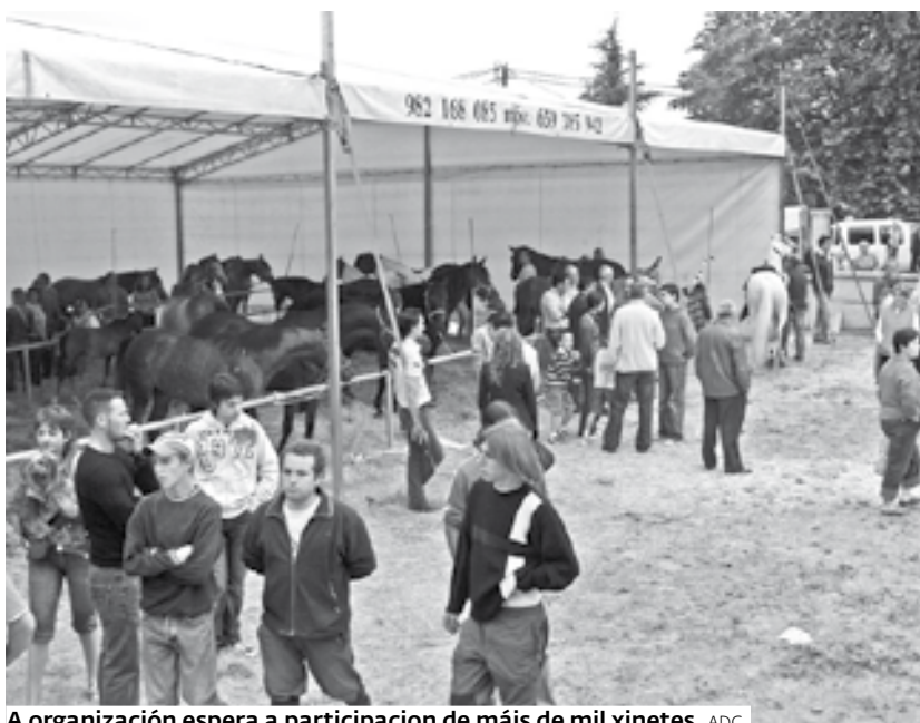
A organización espera a participación de máis de mil xinetes. ADC

Dende esta mesma tarde persoal do Concello e asociados do citado colectivo comezarán coa montaxe da infraestrutura para acoller a Feira do Cabalo, unha cita que, segundo o alcalde, serve ademais para «promocionar e dinamizar o municipio do Corgo».